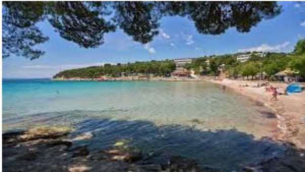
Slika 5: plaža Slanica