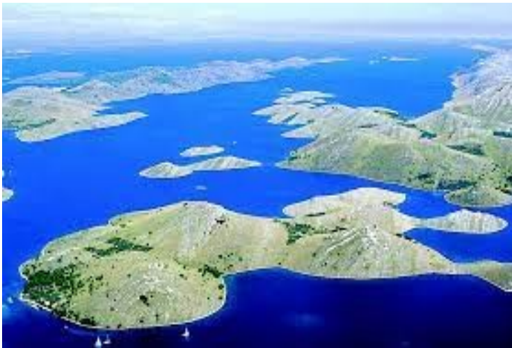
Slika 2: NP Kornati

primjenjuju i pri samim izlascima na obalu, tako da svaki međašni zid sadrži okretne, na licu mjesta inovirane načine kako savladati prirodnu barijeru i učiniti je dijelom željenog rasporeda. Kornatski pašnjački suhozidi koji presijecaju dijelove otoka na obiteljska vlasništva jedni su od najpoznatijih krajobraznih prizora u Hrvatskoj, neizostavni dio svakog vizualnog predstavljanja zemlje i, zajedno sa strmcima, najveća atrakcija NP Kornati.