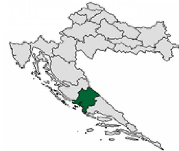
Slika 0-1 Šibensko-kninska županija

se more ne smije podcjenjivati. Izloženo je jakim vjetrovima i naglim promjenama vjetra te jakim morskim strujama pa nautičari u njegovim vodama uvijek moraju biti oprezni.