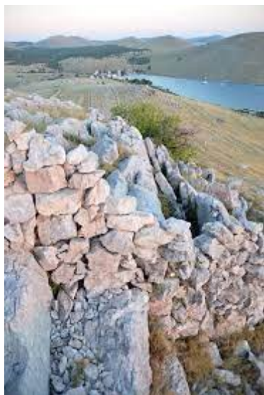
Slika 3: Kornatski suhozid